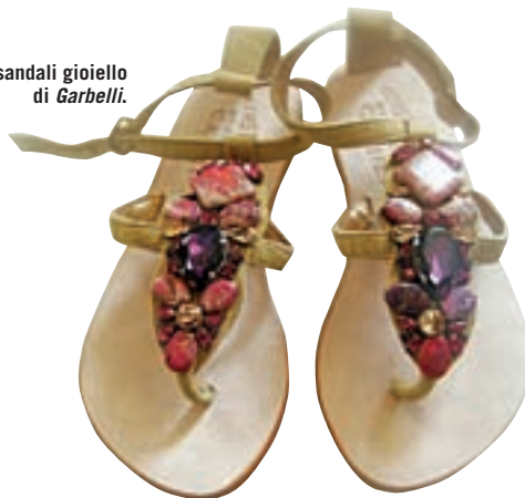
I sandali gioiello di Garbelli.