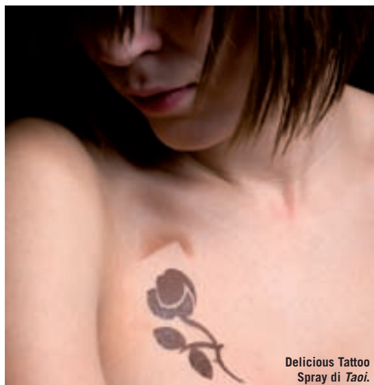
Delicious Tattoo Spray di Taoi.