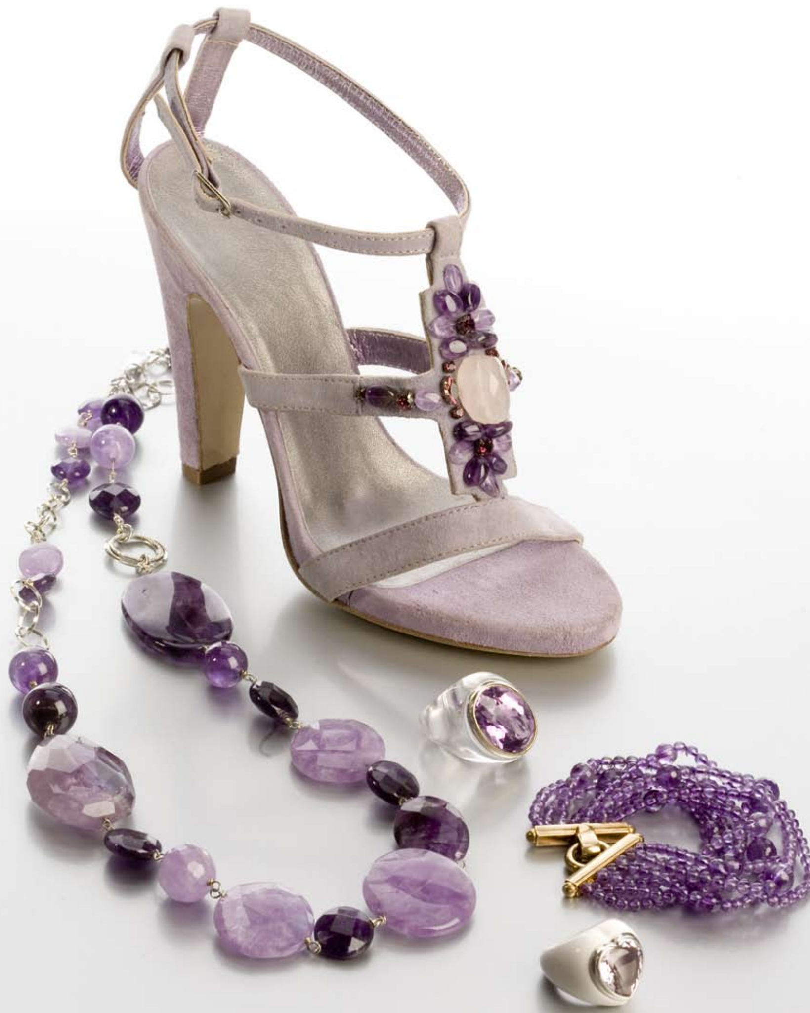
GEMSTONESHoes by I GARBELLI BIJOUX